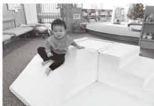
運動教具ハイハイの丘【地域子育て支援センター事業】

ENEOSリニューアブル・エナジー株式会社様が日出町に隣接する杵築市山香町に風力発電施設の建設を進めています。この事業実施に伴い、近傍指定地区への地域貢献事業として日出町社会福祉協議会が行う地域福祉推進のための事業にも支援していただけることになりました。令和6年度は地域子育て支援センター事業を中心に児童館事業、フードバンク事業に関連する物品購入に係る経費を支援していただきました。購入した物品は今後、子育て支援、生活困窮者支援等地域福祉のために活用させていただきます。ありがとうございました。