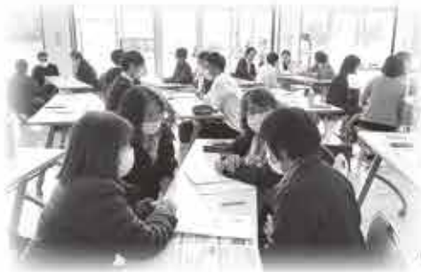
情報交換を行う参加者