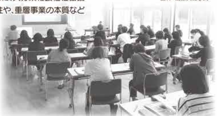
熱心に講義を聞く参加者の皆さん

講義の中で重層事業は、新しいものをつくる訳ではなく、従来、縦割りになっているものに横串をさし、各機関や地域で積み上げてきた取り組みを丁寧に見直して、重なっている部分をつなぎ合わせることで、チーム支援の強化を図るという考え方を伺いました。また、障害や高齢、子ども等、分野の違う相談支援者との情報交換を行いました。