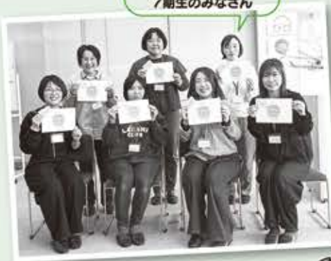
ホームビジター 7期生のみなさん

研修を受けた地域の子育て経験者(ビジター)が訪問します。 週に一回、2時間、訪問し、友人のように寄り添いながら「傾聴」(気持ちを受け止めながら話を聴く)や「協働」(育児家事や外出を一緒にする)の活動をします。